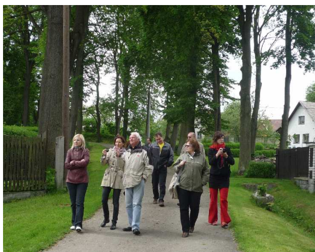
(na snímku krajská komise při prohlídce osady Petrova Lhota)

V měsíci dubnu jsme se přihlásili do soutěže Vesnice roku 2010. Tato soutěž je určena pro všechny obce, které mají zpracovaný vlastní program obnovy vesnice a trvale je v nich hlášeno maximálně 5 250 obyvatel. Jejím cílem je snaha povzbudit obyvatele venkova k aktivní účasti na vývoji svého domova, zveřejnit rozmanitost a pestrost uskutečňovaných programů obnovy vesnic a prokázat široké veřejnosti význam venkova. Z tohoto důvodu nás 31. 5. 2010 navštívila krajská hodnotitelská komise složená ze zástupců vyhlášovatelů a spoluvyhlašovatelů této soutěže, kterými jsou Ministerstvo pro místní rozvoj ČR, Ministerstvo zemědělství ČR, Ministerstvo životního prostředí, Krajský úřad Středočeského kraje, Svaz měst a obcí, Svaz knihovníků a informačních pracovníků, Památkový úřad a starostové úspěšných obcí minulých let. Soutěž je organizována ve dvou kolech – krajském a celostátním. Výsledky krajského kola, do kterého se v letošním již 16. ročníku přihlásilo 27 obcí Středočeského kraje, budou známy počátkem července. V průběhu této návštěvy jsme kromě prohlídky obce představili náš kulturní a společenský život a všechny zrealizované i plánované pracovní záměry.